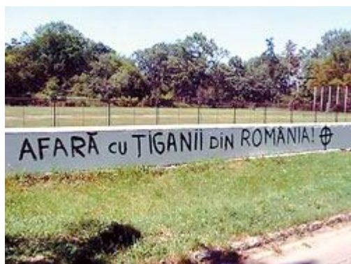
Inscripții rasiste împotriva romilor