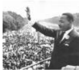
Martin Luther King, liderul mișcării civice de emancipare a americanilor africani din SUA

„Când ne uităm la omul modern trebuie să recunoaștem că el suferă de o sărăcie a spiritului care contrastează puternic cu abundența tehnologică. Am învățat să zburăm ca păsările, am învățat să înotăm ca peștii, și nu am învățat încă să ne purtăm unii cu alții ca frații și surorile.” (Dr. Martin Luther King)