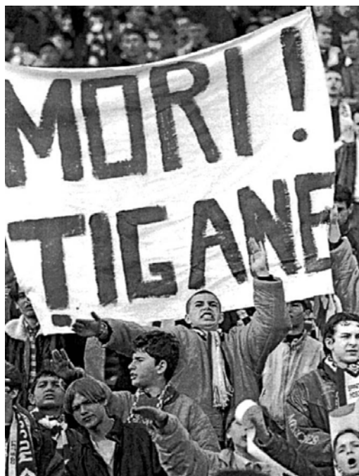
Lozinci rasiste la un meci de fotbal