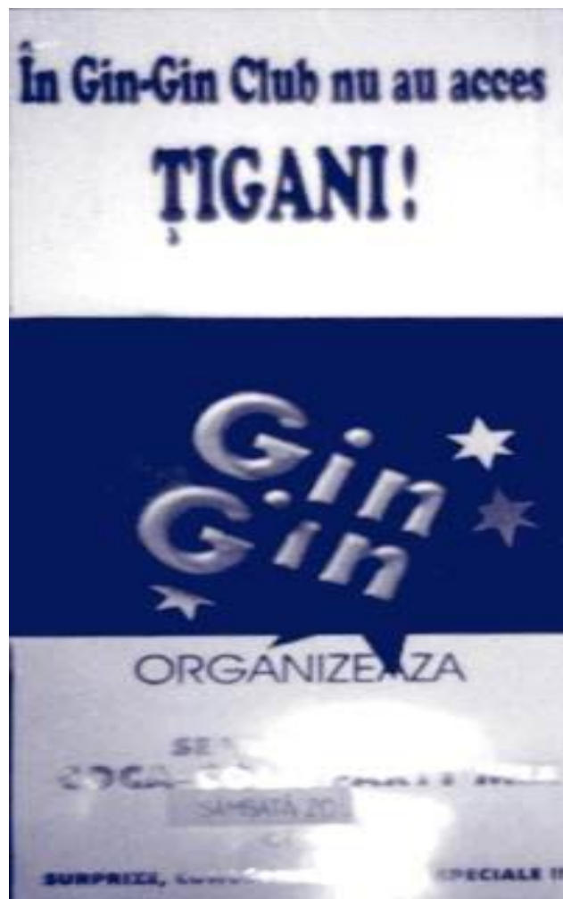
Exemplu de rasism instituțional vizibil

- ascuns : în școlile cu majoritatea elevilor romi nu există nici un părinte rom în Consiliul de administrație al școlii; poliția nu intervine în