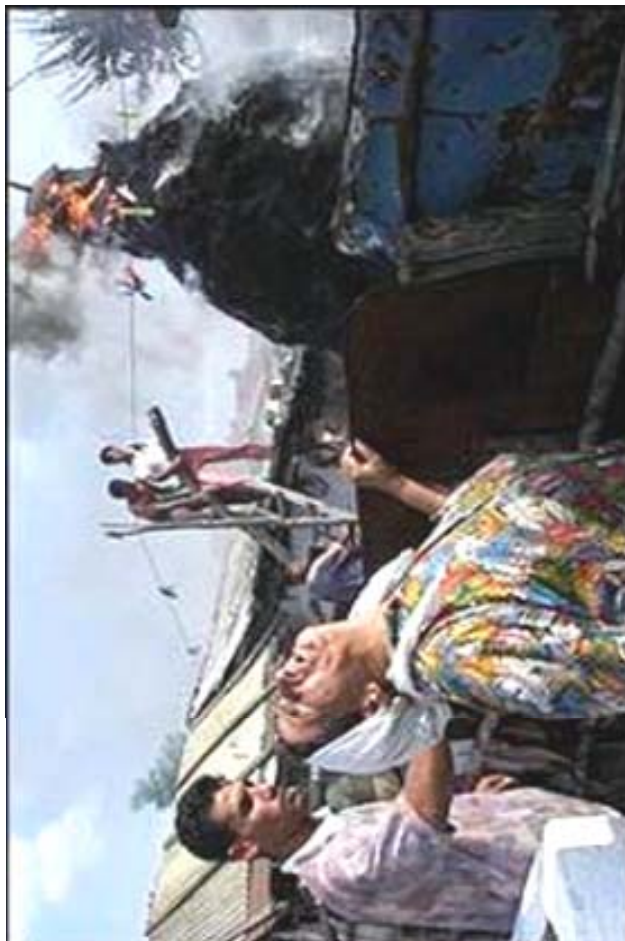
Masacrarea romilor în Kosovo, în timpul războiului civil sârbo-albanez din deceniul trecut

Romii s-au stabilit în urmă cu aproximativ 7-800 de ani pe teritoriul românesc. În 1374 are loc prima atestare documentară a sclaviei lor (Dan I Voievod dăruiește ctitoriei sale, Mănăstirea Vodița, "40 de