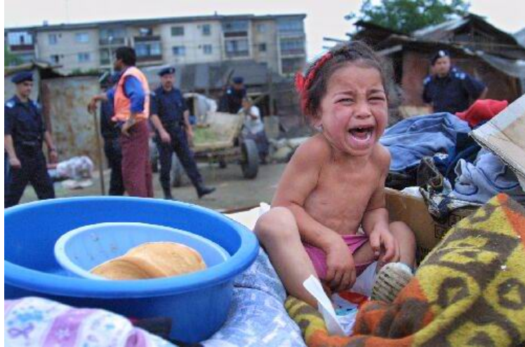
Evacuări forțate din locuințe

Romii sunt victime ale rețelelor de trafic uman și migrație ilegală. Aceste ultime aspecte au devenit așazise motive pentru mass-media și politicienii români și occidentali să folosească discursuri bazate ură și teorii ale țapului ispășitor.