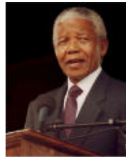
Nelson Mandela, liderul mișcării anti-apartheid din Africa de Sud