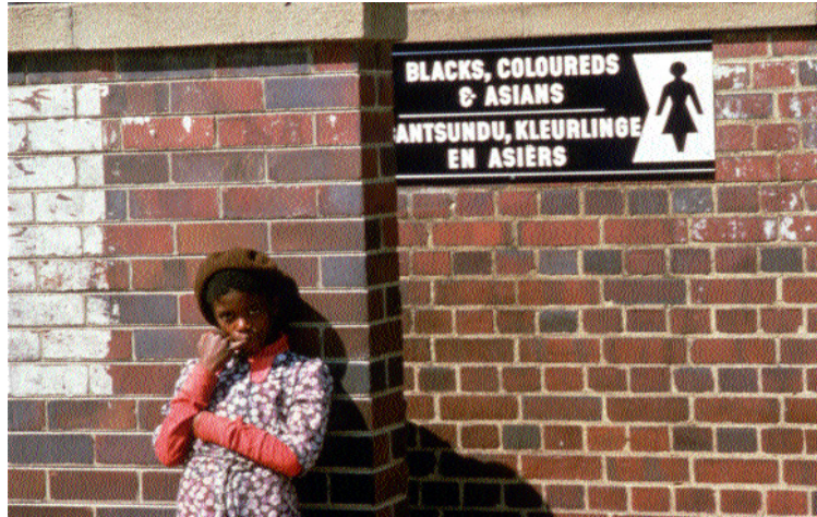
Toalete publice pentru negri și asiatici separate de cele pentru albi în Africa de Sud