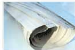
operational după primul an de existență. Indiferent de caz, lipsește transparentizarea

Lansata ieri în cadrul unei dezbateri organizate de Agentia de Monitorizare a Presei și Centrul pentru Jurnalism Independent, a treia ediție a "Cartii albe a presei" scoate la lumina principalele probleme cu care se confruntă astăzi mass-media românească: legislația lacunara, deficitul de forță de muncă calificată, sistemul de distribuție primitiv pentru presa scrisă, trecerea anevoioasă spre digitalizare, veniturile insuficiente.