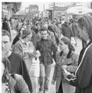
Comunicarea trebuie să ajute persoanele cu tulburări psihice